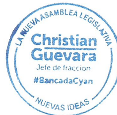
Diputado Christian Reynaldo Guevara Guadrón Coordinador del Grupo Parlamentario Nuevas Ideas.