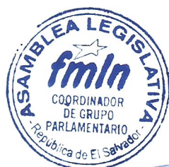
Diputado Jaime Dagoberto Guevara Coordinador del Grupo Parlamentario FMLN