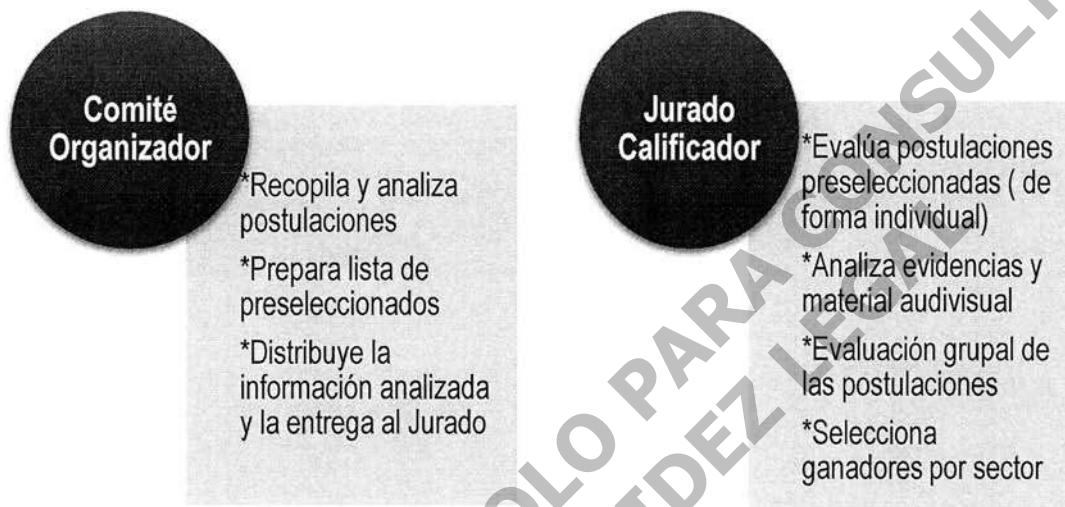
Diagrama 1. Resumen de funciones

Cada integrante del Jurado Calificador realiza una evaluación de las propuestas de acuerdo a los criterios establecidos en estas Bases. Si es necesario verificar lo declarado por los o las finalistas en el Formulario. El Jurado podrá revisar las evidencias y material audiovisual; posteriormente sostendrá una reunión para seleccionar de manera conjunta a las personas ganadoras (Diagrama 1).