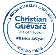
Diputado Christian Reynaldo Guevara Guadrón Coordinador del Grupo Parlamentario Nuevas Ideas.